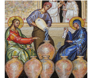
Les noces de Cana Saint Jean (2,1-11)

3 - Pour être un même corps, vivant la même vie, Nous sommes ton peuple, Pour prendre un même pain et boire un même vin, Nous sommes ton peuple et nous te rendons grâce par Jésus ton enfant.